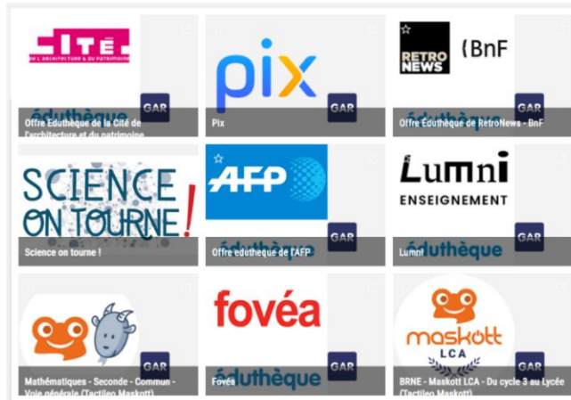
Exemples de ressources dans le Médiacentre

Le Médiacentre permet aux élèves et aux enseignants d'accéder aux bouquets de ressources numériques proposés par les éditeurs sur Internet.